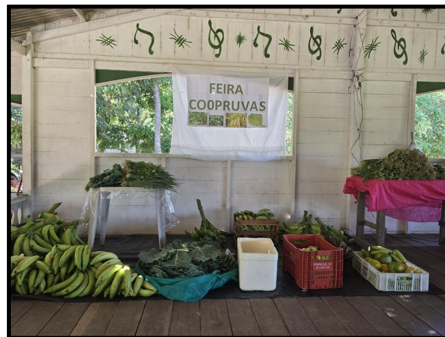
Cooperativa de Pescadores e Produtores Rurais da Região do Urucurituba Várzea de Santarém – Pará – Brasil (COOPRUVAS)

O CAF possibilitou ao AGRICULTOR FAMILIAR (grupos organizados ou grupos informais) sejam ribeirinhos, indígenas e/ou quilombolas o aumento da produtividade, a diversificação de suas culturas e a elevação da renda e da qualidade de vida no meio rural, garantindo que o agricultor pudesse, inclusive, atender demandas como a do PNAE com potencial para chamadas públicas diferenciadas.